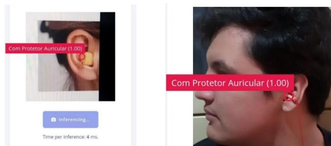
FIGURA 4. Teste do Modelo.

É importante destacar que a indicação de 100% na detecção do objeto não significa que a rede tenha 100% de precisão geral. Esse valor indica que, neste caso específico, a rede está totalmente confiante de que o objeto detectado corresponde à classe "com protetor auricular".