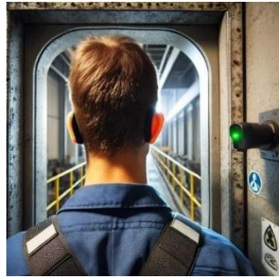
FIGURA 1. Ilustração gerada por inteligência artificial representando um trabalhador sem protetor auricular (ChatGPT/DALL-E, 2024).

Para o treinamento do modelo, utilizou-se uma base de dados composta por 503 imagens sem pré-processamento, capturadas pelos autores em um ambiente controlado utilizando uma câmera de celular, sendo as imagens distribuídas de forma equilibrada entre as duas classes: "com protetor auricular" e "sem protetor auricular". Foi adotado o método de caixas delimitadoras fornecido pelo recurso de detecção automática do Edge Impulse, que identifica padrões nas imagens e gera caixas ao redor dos objetos detectados. As imagens de entrada foram configuradas no tamanho de 320x320 pixels e em formato RGB, como visto na Figura 2.